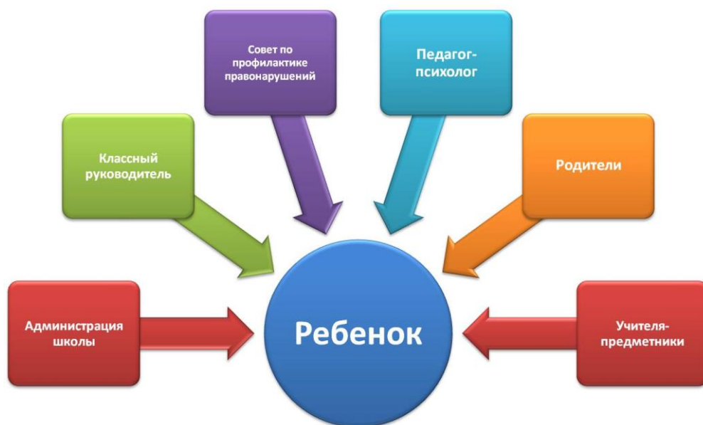
СХЕМА СОТРУДНИЧЕСТВА УЧАСТНИКОВ ВОСПИТАТЕЛЬНОГО ПРОЦЕССА ПО ПРОФИЛАКТИКЕ ПРАВОНАРУШЕНИЙ, БЕЗНАДЗОРНОСТИ И НАРКОМАНИИ СРЕДИ НЕСОВЕРШЕННОЛЕТНИХ